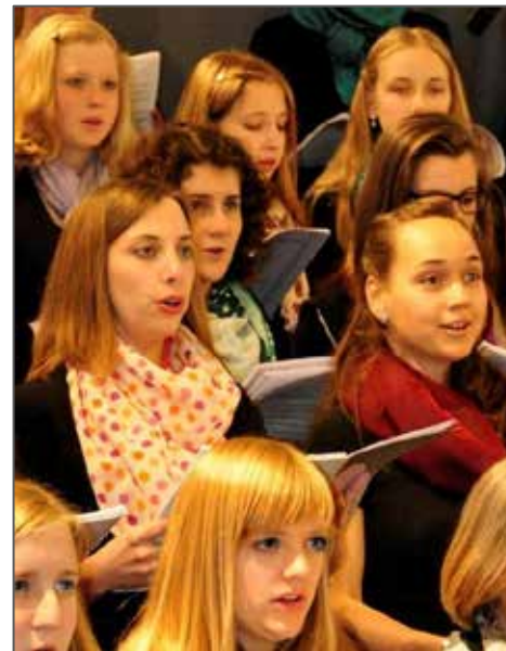
Ein offenes Chorprojekt mit großer Begeisterung wie 2013 (Foto) kündigt sich an.