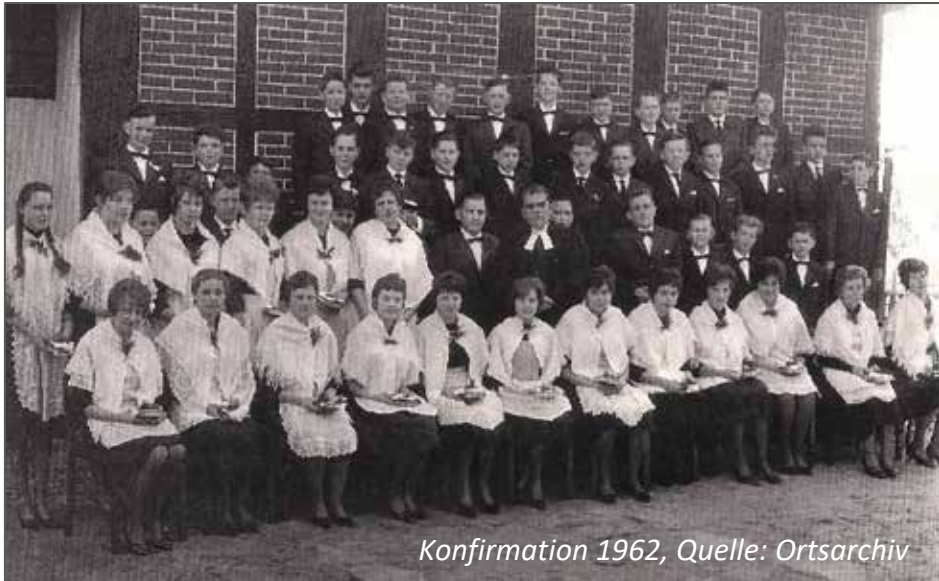
Konfirmation 1962, Quelle: Ortsarchiv

Bitte im Kirchenbüro unter 05163 - 329 oder per E-Mail: KG.Dorfmark@evlka.de melden.